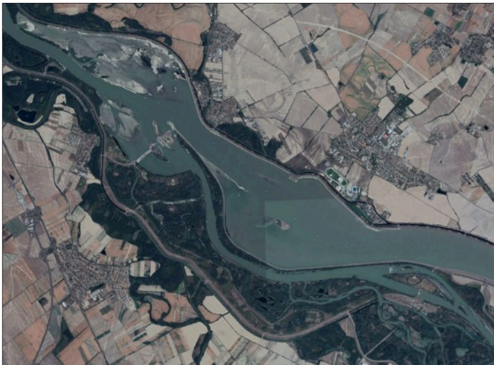
Obr. 3 Zmeny morfológie koryta Dunaja v úseku pod Bratislavou v období r. 2007-2009 (SVP š. p., OZ Bratislava) - červenou sú vyznačené lokality s prírastkom sedimentov až do 4 m.